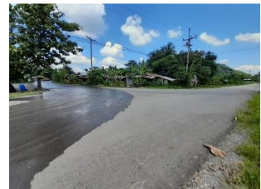
ทางแยกเข้าสู่พื้นที่โครงการ